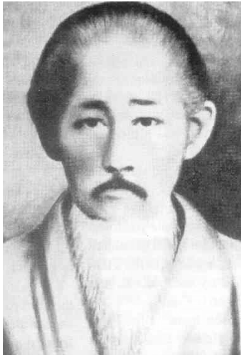
Kanryo Higaonna (1853 - 1915)