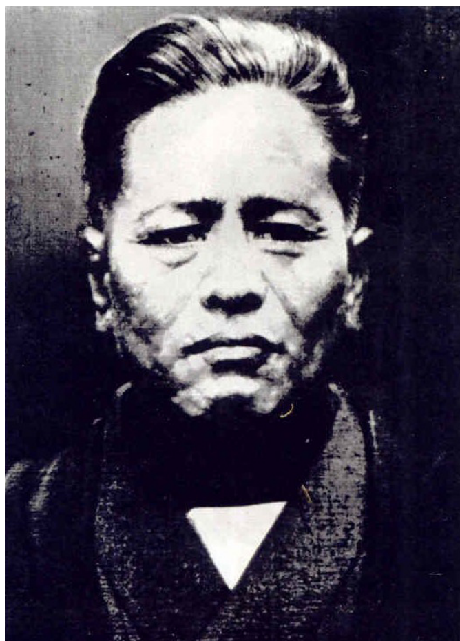
Chojun Miyagi (1888 - 1953)

Skutečným zakladatelem Goju Ryu byl mistr Chojun Miyagi, osobní žák mistra Kanryo Higaonny. Chojun Miyagi se setkal s Kanryo Higaonnou ve čtrnácti letech. Společně pak zdokonalili umění Naha Te. Strávili společně třináct let až do smrti Kanryo Higaonny v roce 1916. Chojun Miyagi pocházel ze šlechtické rodiny. Vlastnili dvě obchodní lodi, které dovážely z Číny medicínu pro jak pro vládu tak pro soukromé osoby. Tentýž rok, ve kterém Kanryo Higaonna zemřel, odjel Chojun Miyagi do čínského Foochow objevovat kořeny Naha Te. Bohužel v té době probíhaly revoluční boje a tak se vrátil na Okinawu. Byl to člověk silné vůle a dosáhl vynikajících studijních výsledků. Denně trénoval, často v přírodě v nelítostných podmínkách, a prováděl různá cvičení pro rozvoj svých smyslů. Vytvořil několik kat.